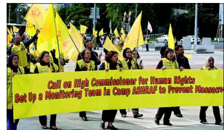
Demonstratie in september bij het Europese hoofdkwartier van de Verenigde Naties in Genève tegen de situatie in kamp Ashraf.

De auteur is donateur van de Stichting Mensenrechten. Vrienden, die zich inzet voor de mensenrechten in Iran.