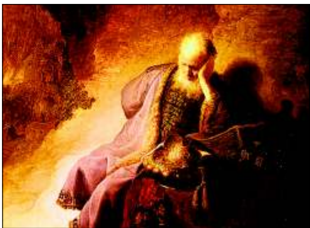
„Veel Bijbelse personen worden geroepen ondanks hun talent.” Foto: de profeet Jeremia (schilderij van Rembrandt).

Bekwaamheden vooraf bepalen niet hun specifieke taak. Dan hadden we immers de tollenaar Levi krentmeester gemaakt, en de wetgeleerde Paulus Jodenapostel. Pas daar-