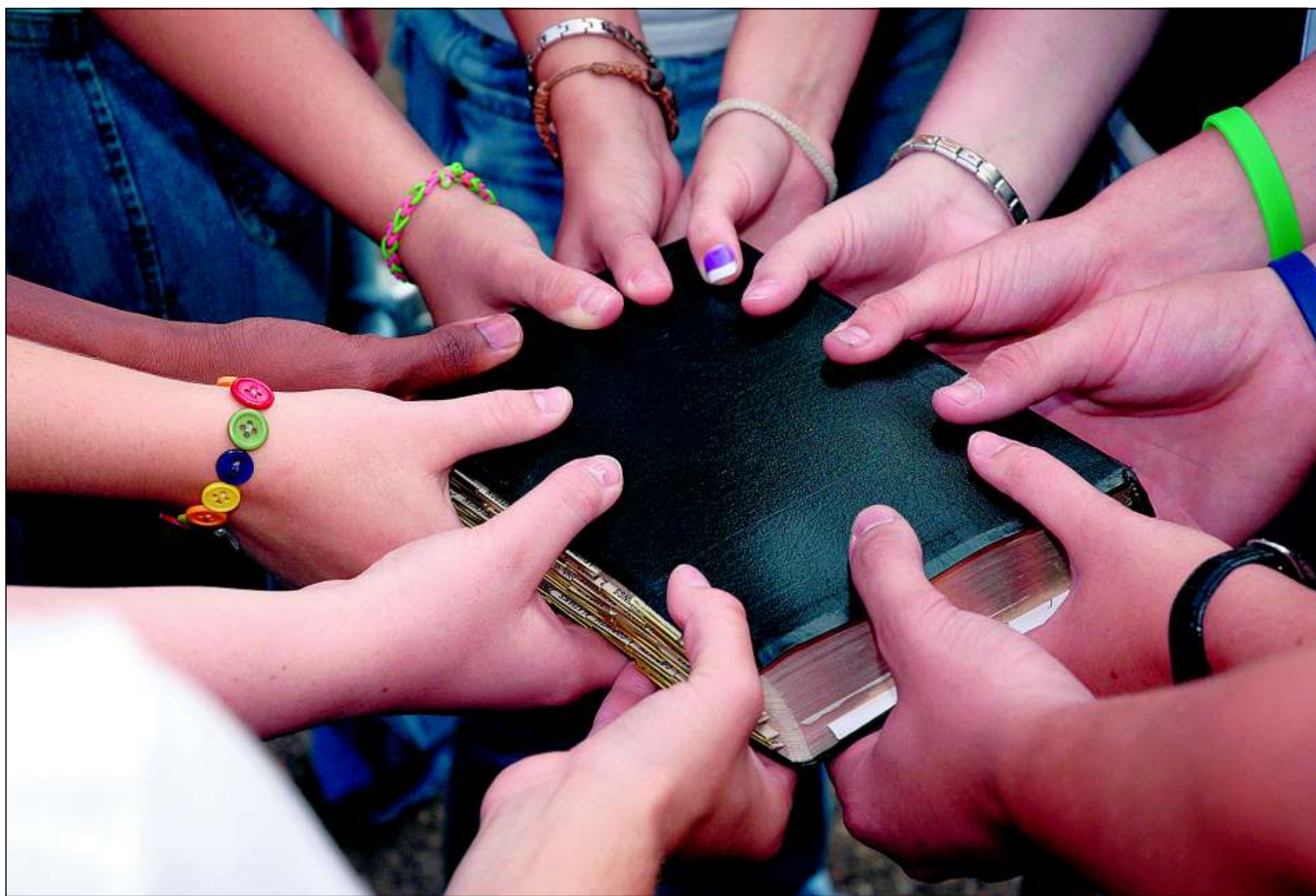
„Naar mijn idee is het gemakkelijker om in deze tijd het Woord van God te verkondigen dan enkele decennia geleden. Het vraagt wel veel creativiteit. Daar staat tegenover dat dit tegemoetkomt aan een verlangen in de gemeente, ook onder jongeren, om daadwerkelijk aangesproken te worden door het Woord van God.”

De cognitieve manier van Bijbelgebruik plaatst de jongere op een afstand van de Bijbel. Vanuit de didactiek is immers bekend dat cognitief leren vaak afstandelijker is en buiten de eigen existentie omgaat. Het eigen bestaan gaat eerder meedoen als er via ervaring wordt geleerd. Jongeren worden alleen gestimuleerd om zelf de