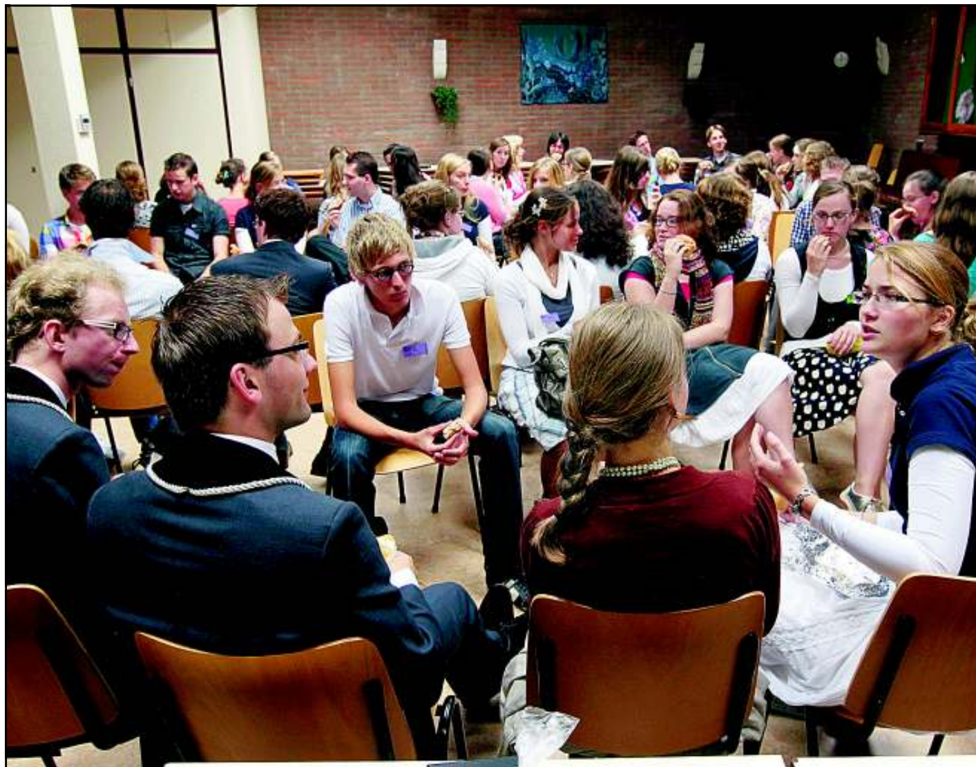
UTRECHT – Een veertigtal nieuwe studenten kwam vorige week een kijkje nemen op de introductiedag van de studentenvereniging Depositum Custodi. Na een introductieprogramma en lunch (foto) gingen ze roeien op de Kromme Rijn.