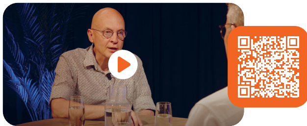
Zaai het Evangeliewoord in de harten van kinderen en jongeren.

Graag zou ik tegenover de gedachte van 'investeren' de gedachte van 'zaaien' zetten. Zaad wordt gezaaid en heeft goede grond, water en zonlicht nodig om te groeien. Is dat niet precies hoe ons werk met en voor de jonge mensen in de kerk zou moeten zijn? Zaai het Evangeliewoord in de harten van de kinderen en jongeren, op allerlei manieren; in de prediking, op de club, op de zondagsschool, tijdens catechisatie. En dan? Verzorg de ingezaaide grond met liefde, aandacht en toewijding en heb geduld! Gods Woord zal niet vruchteloos tot Hem terugkeren (Jesaja 55:11).